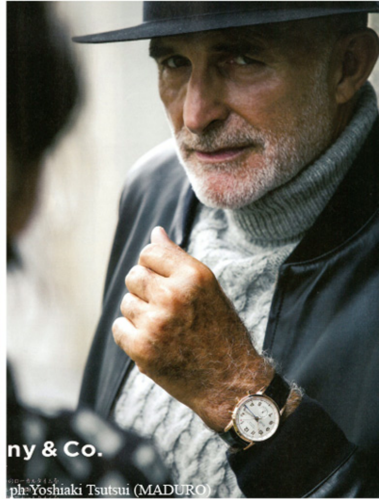
ny & Co.

クローゼットで選んだのは、クラシックななかにもどこかフォーマルな装やまが生まれるのです。スーツ 25万7250円、シャツ2万1000円、タイ1万6800円、チーフ7875円、靴参考商品。すべてパル ジェリ (パル ジェリ ジャケット)